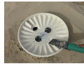
29. Vierta indirectamente 4 litros (1 galón) de agua en la abertura central. No erosione el suelo en las raíces de los árboles vertiendo agua directamente sobre él.