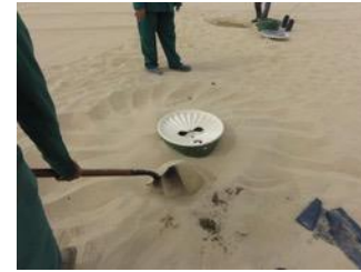
24. Cubrir con arena alrededor de la caja