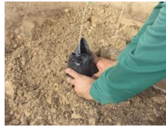
18. Colocar el árbol con la bolsa y luego retirar la bolsa