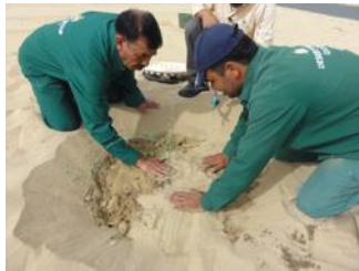
21. Cubra las plantas con arena - coloque la cubierta antie evaporación - no use el pie para compactar el suelo lo que hace con agua después.