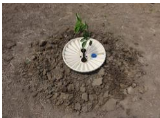
26. Remover el suelo alrededor de la caja para eliminar malezas y bloquear así la evapotranspiración del agua capilar