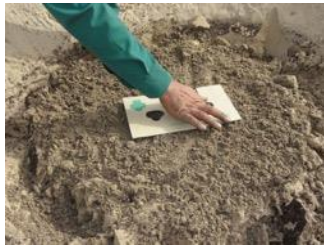
16. Colocar la cubierta antie evaporación en dirección este-oeste