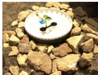
27. Si tienes piedras disponibles, cubre el suelo