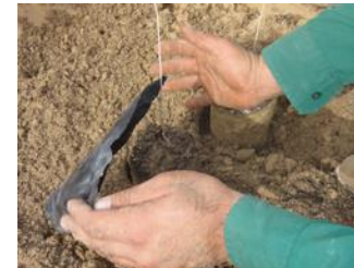
19. Quitar el plástico al momento de plantar