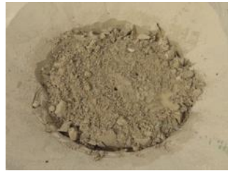
17. Disponer la distancia de plantación en dirección este-oeste