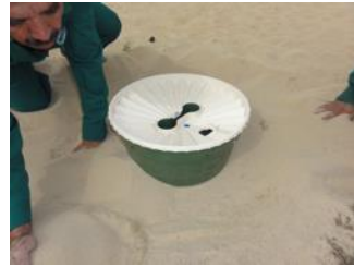
23. Colocar el Groasis Waterboxx® por sobre los árboles y a través de las abertura central