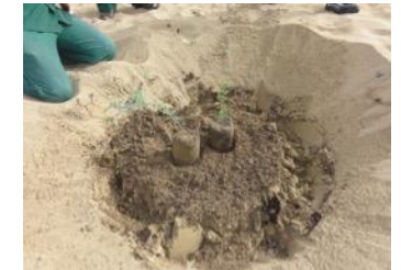
20. Pones las raíces de las plantas en la arena, en esta foto están plantadas sobre la arena, eso está mal.