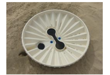
30. Luego llene el Groasis Waterboxx® con 16 litros (4 galones) de agua