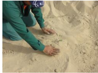
22. Agregue 10 cm (4 pulgadas) de tierra solo en la cubierta antie evaporación antes de colocar el Waterboxx®