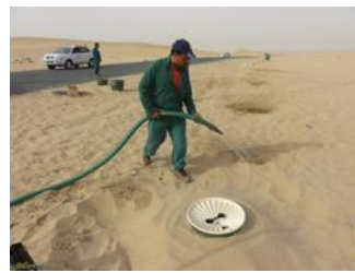
28. Verter 5 litros de agua en el depósito